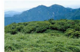
仙ヶ岳 (入道ヶ岳方面から)