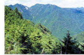
宮指路岳 (仙鷲尾根方面から)